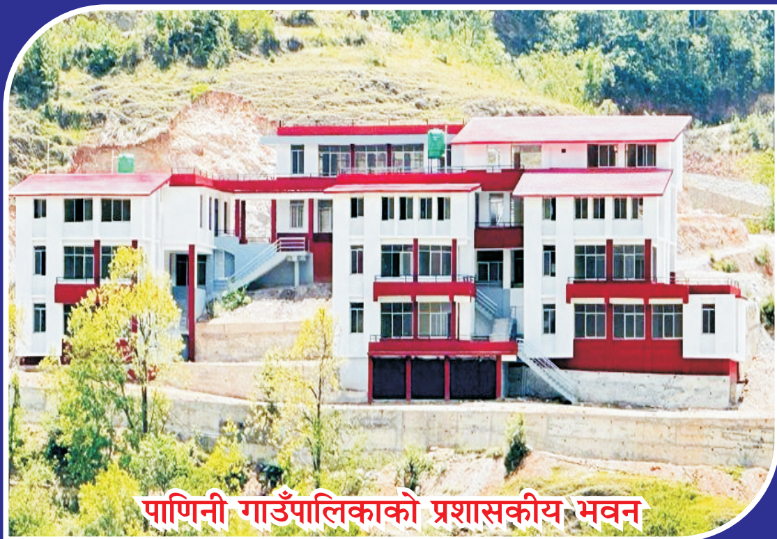
पाणिनी गाउँपालिकाको प्रशासकीय भवन